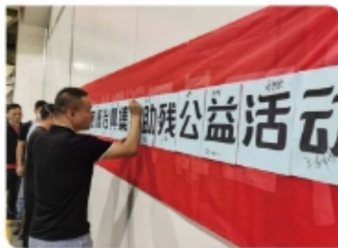
&gt;&gt; 图为富士山下活动现场