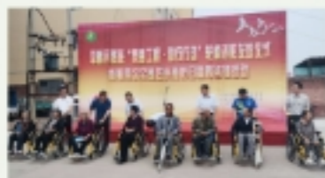
&gt;&gt; 图为配发轮椅现场

根据我会开展的2020年公益助残项目意向申请情况，结合我会现有的助残物资实际情况，我会组织开展实施了2020年“集善工程·助行行动”轮椅项目，免费为贫困肢体残疾患者提供轮椅478辆。