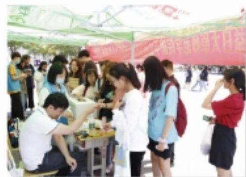
&gt;&gt; 图为太原师范学院线下活动现场

2020年“99公益日”助残公众筹款活动圆满落幕！短短三天，我会联合省内36家非公募机构在腾讯公益平台发