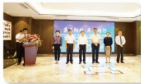
&gt;&gt; 图为出席启动仪式的领导