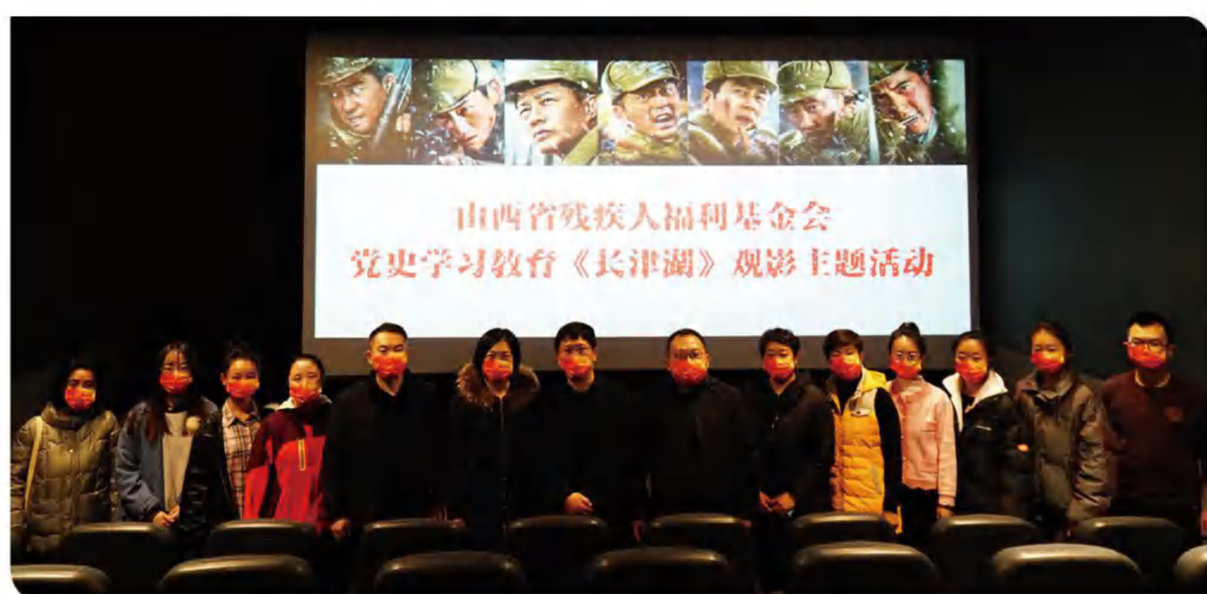
>> 图为观影活动现场

为进一步深化党史学习教育，引导员工厚植爱国情怀，传承红色基因，11月12日，我会组织集中观看红色影片《长津湖》，董先秘书长参加了活动。