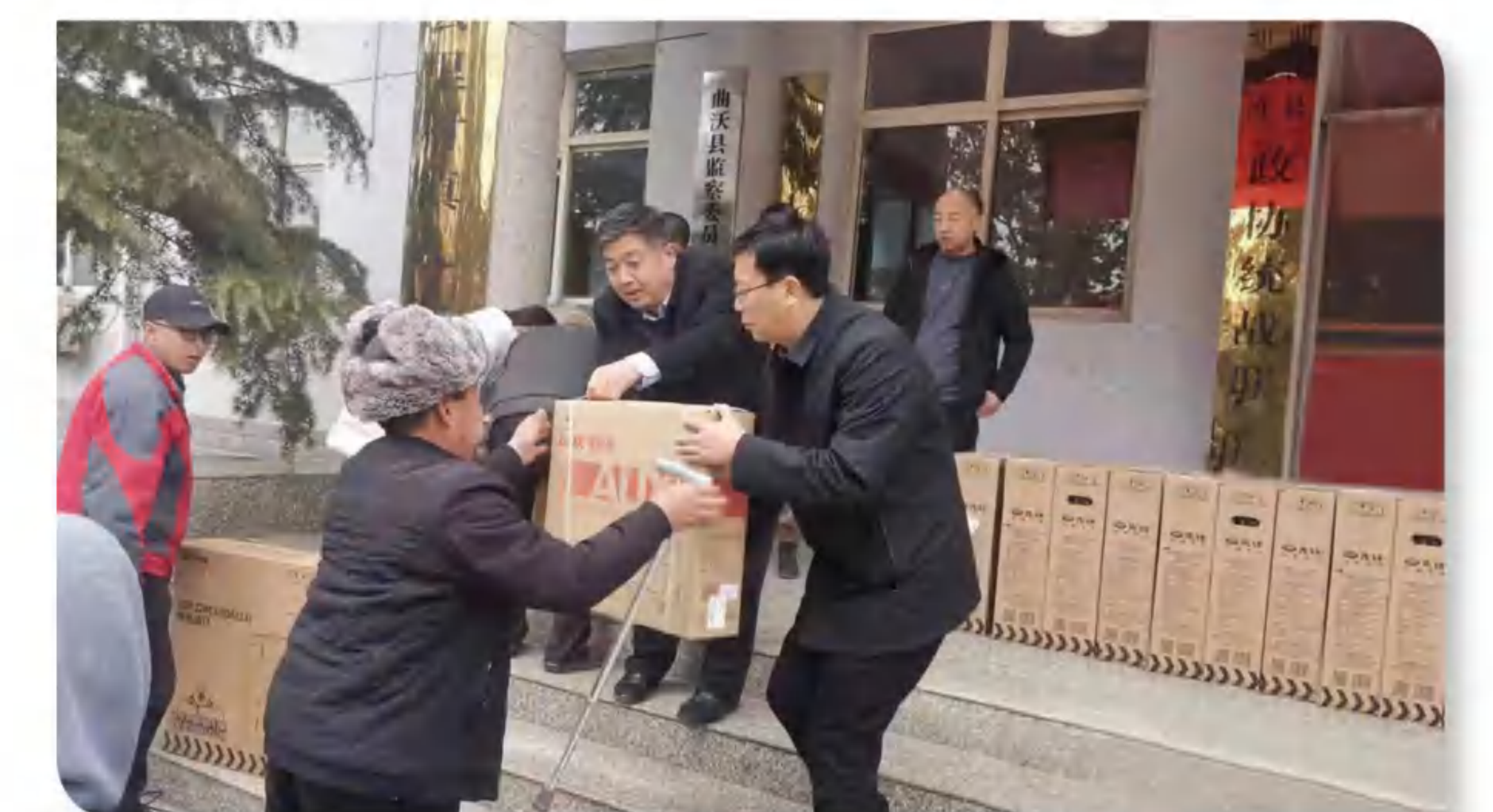
>> 图为“集善助残·暖冬行动”曲沃县物资发放现场