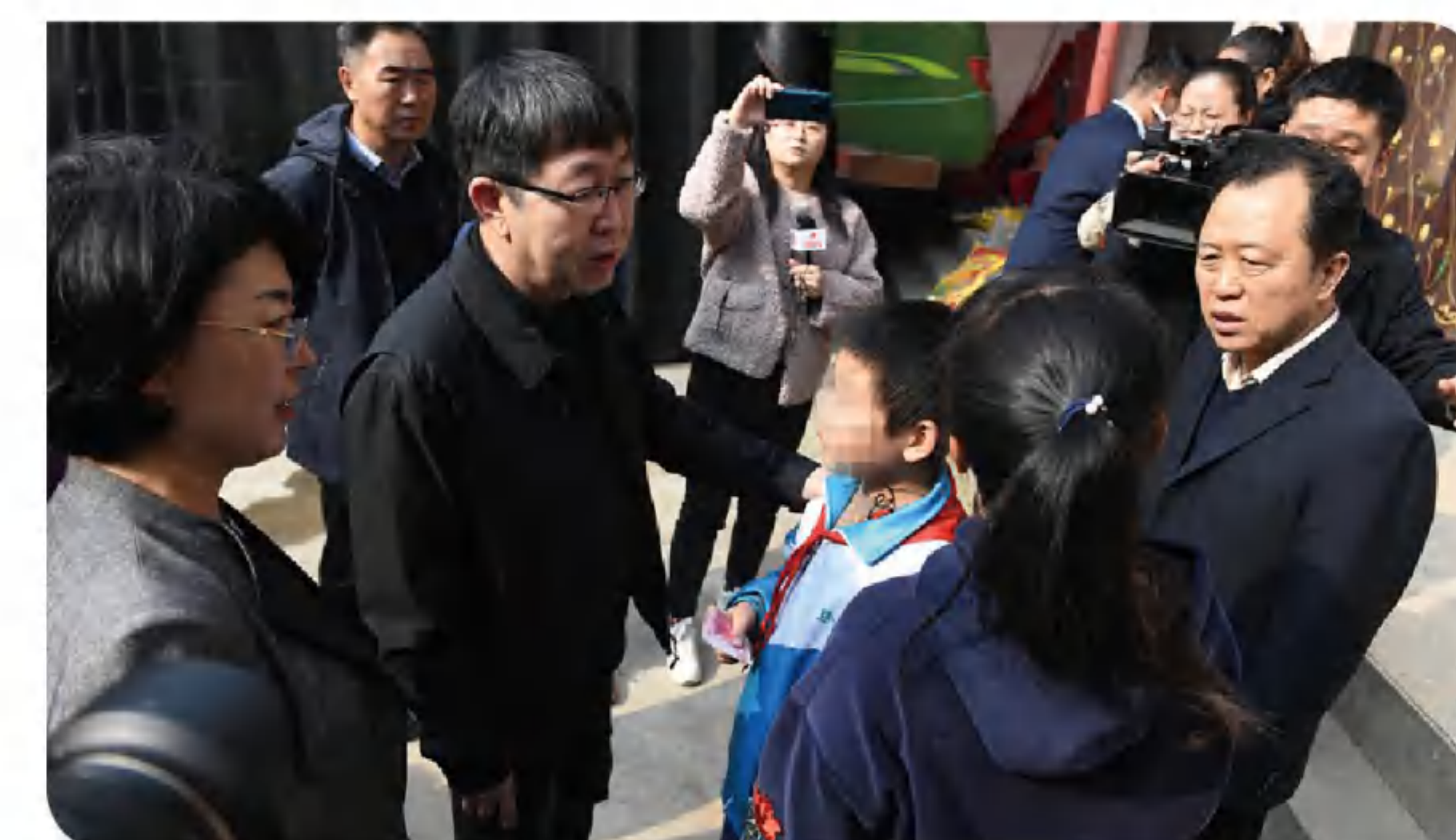
>> 图为省残联党组成员、副理事长温建生一行慰问看望灾区残疾儿童