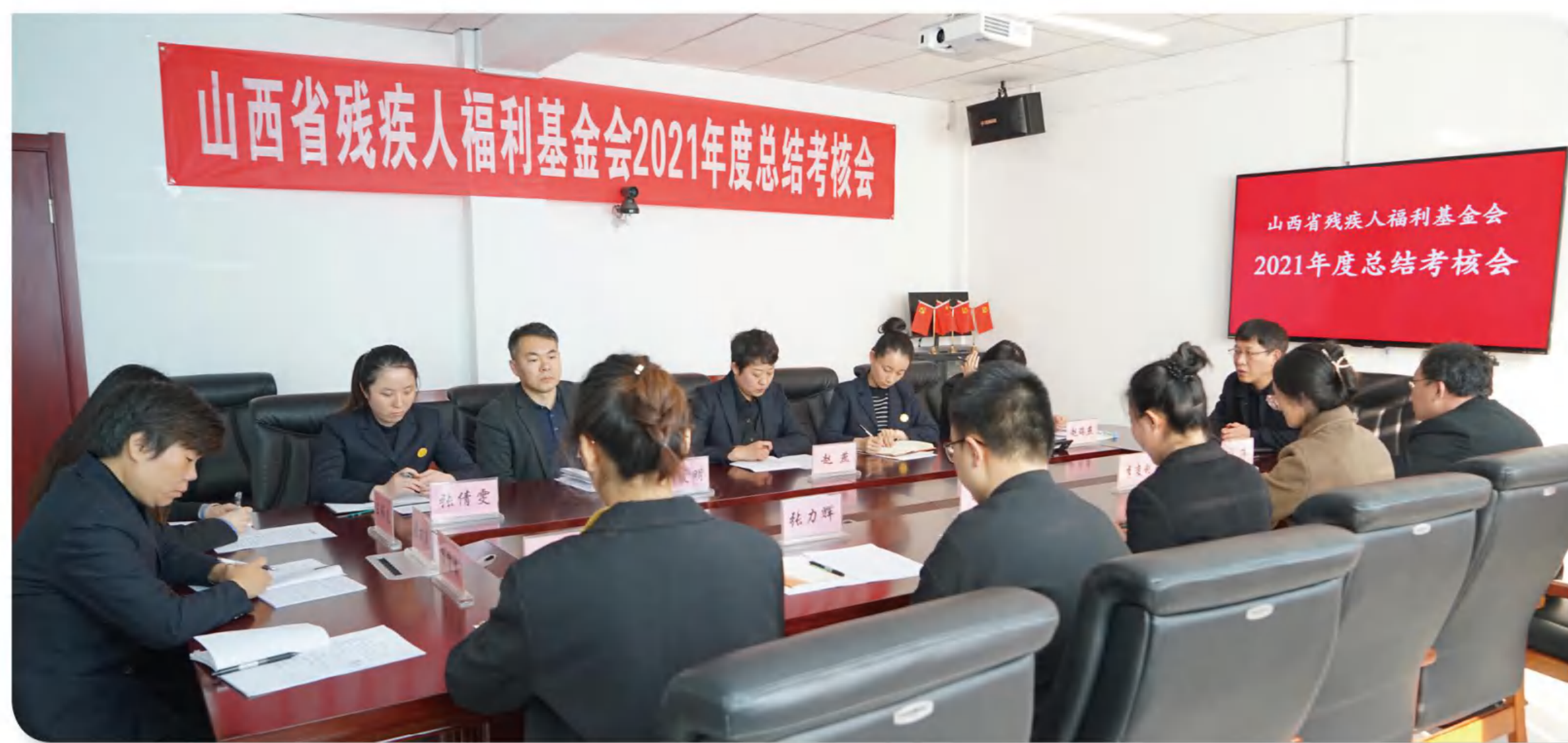
>> 图为总结考核会现场

12月30日下午，我会召开2021年度工作总结考核会。大家分别就各自2021年度工作完成情况、工作中存在的不足和问题进行了述职汇报，并对明年基金会的工作思路及规划谈了自己的建议。述职结束后进行了民主测评。12月31日上午，公布了2021年度考核结果；董先秘书长还就防控疫情、两节值班、慰问调研等事宜做了安排部署。