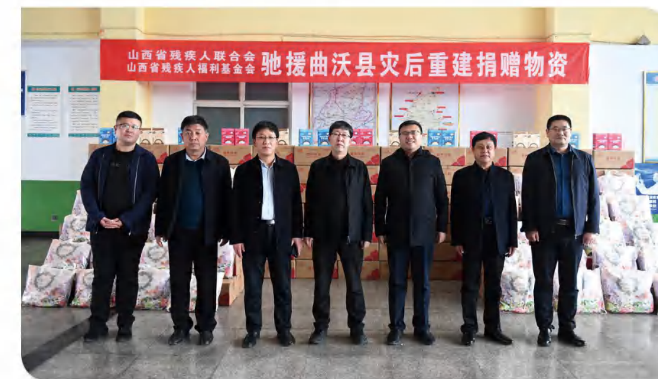
>> 图为曲沃县捐赠灾后重建物资

>> 另外，还收到爱心企业捐赠的食品价值6208元，价值9.15万元的米粉598箱，价值3.48万元的羊绒毯600条。