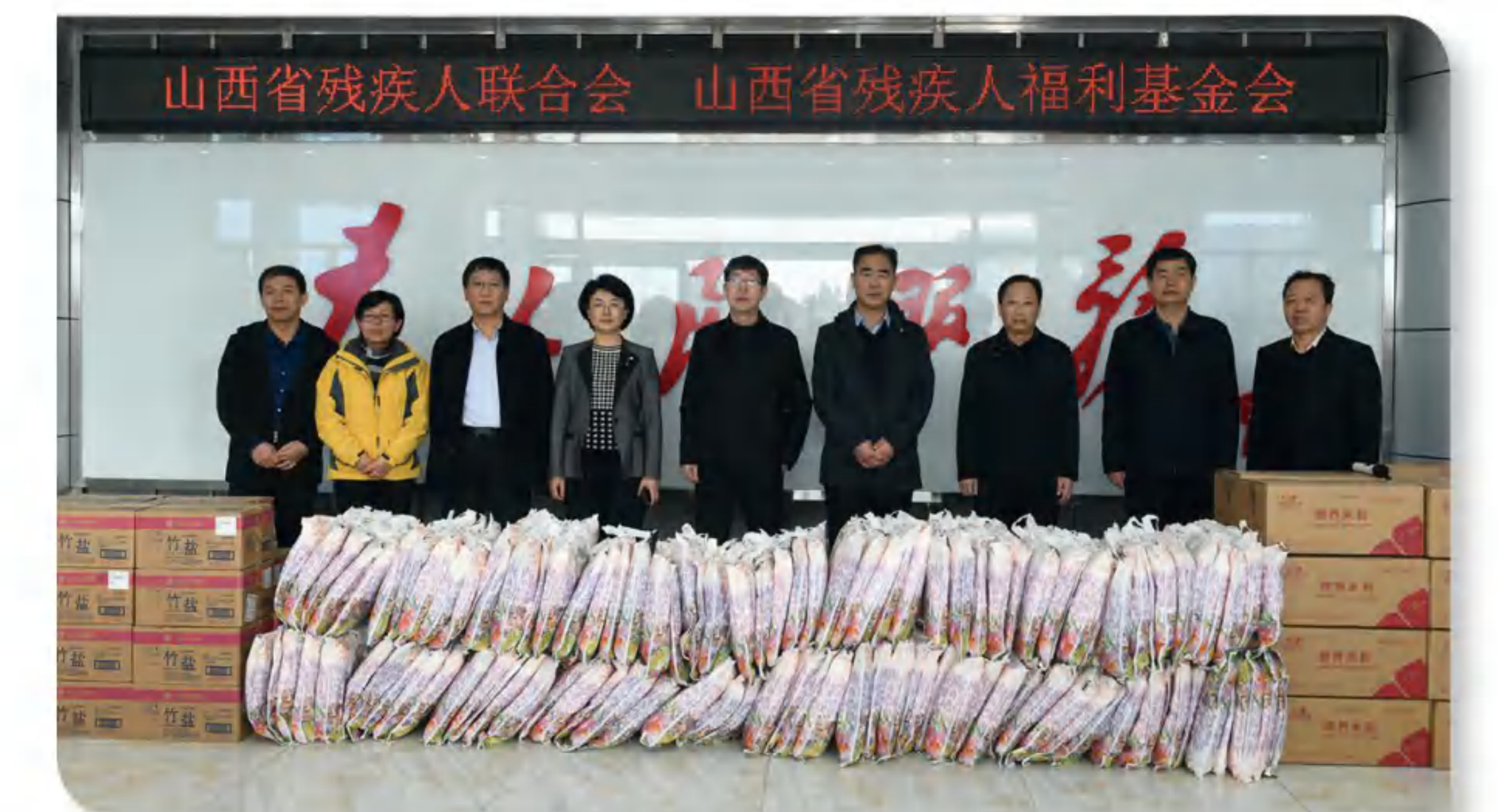
>> 图为稷山县捐赠灾后重建物资