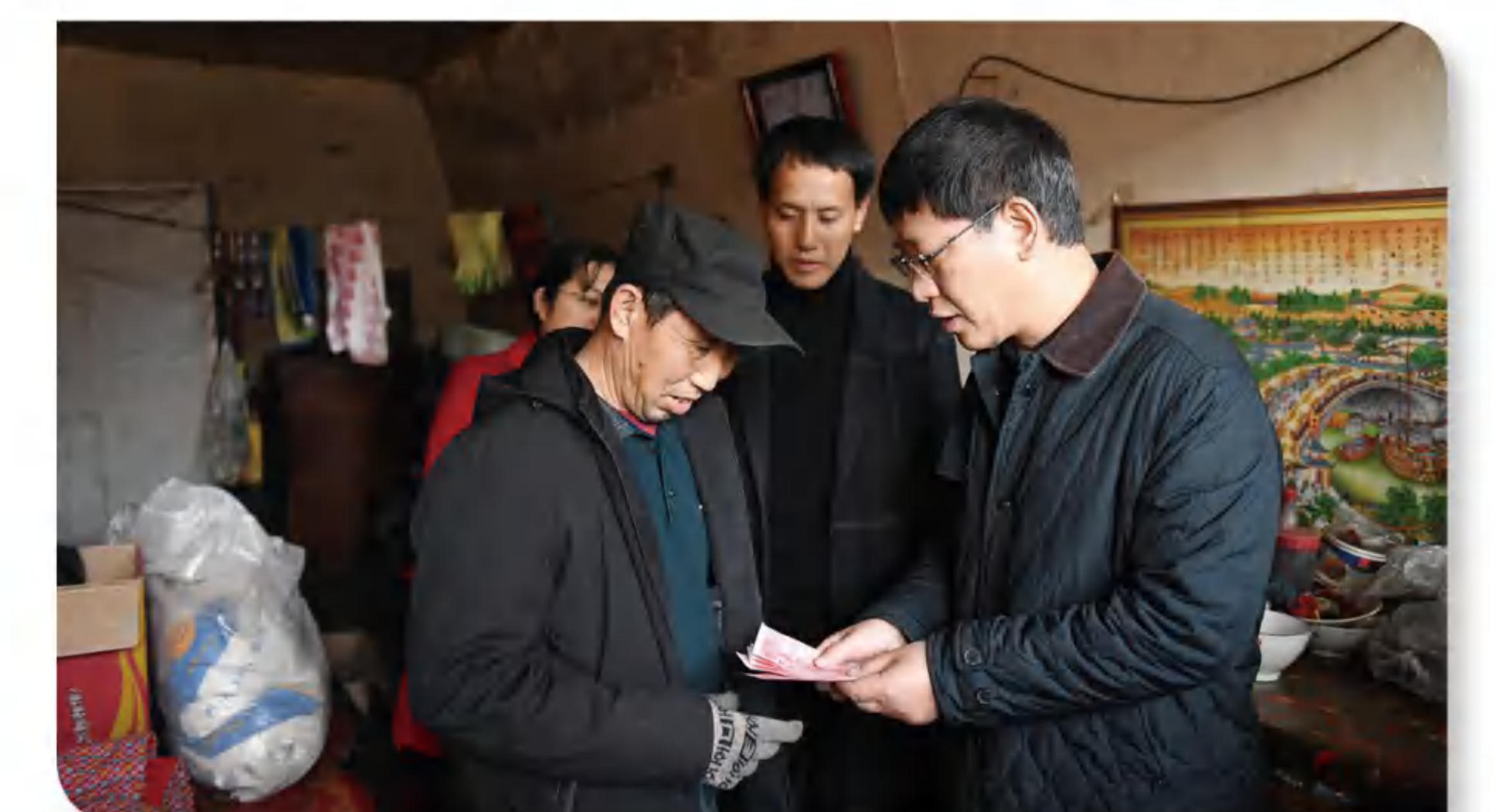
>> 图为董先秘书长为灾区困难残疾人发放慰问金