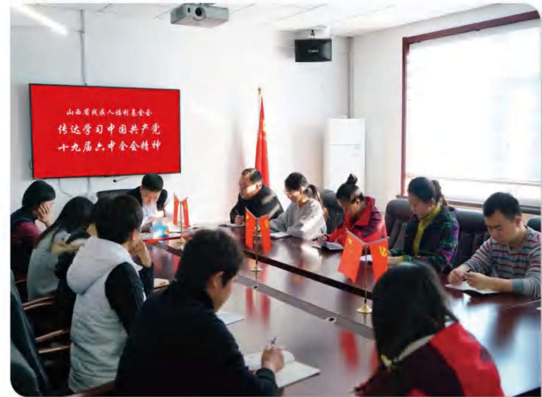
>> 图为学习会议现场

此次会议，帮助新老员工深刻领会了党的十九届六中全会精神，激励大家以全会精神为引领，积极投身于新时期我会慈善助残事业的建设中。