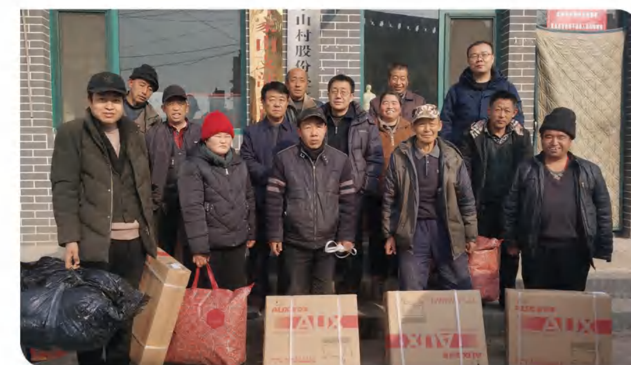
>> 图为“集善助残·暖冬行动”平遥县物资发放现场